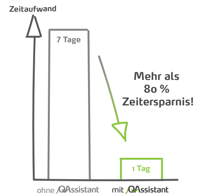
Abb. 3: Neue Services können jetzt durch die getroffenen Maßnahmen wesentlich schneller bereitgestellt werden.