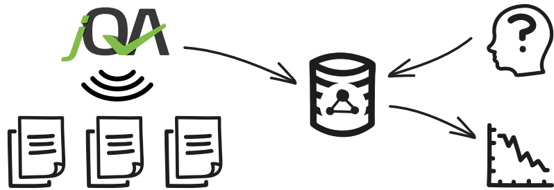
Abb. 1: Mit jQAssistant gescannte Softwareprojekte können sowohl manuell als auch automatisiert ausgewertet werden.